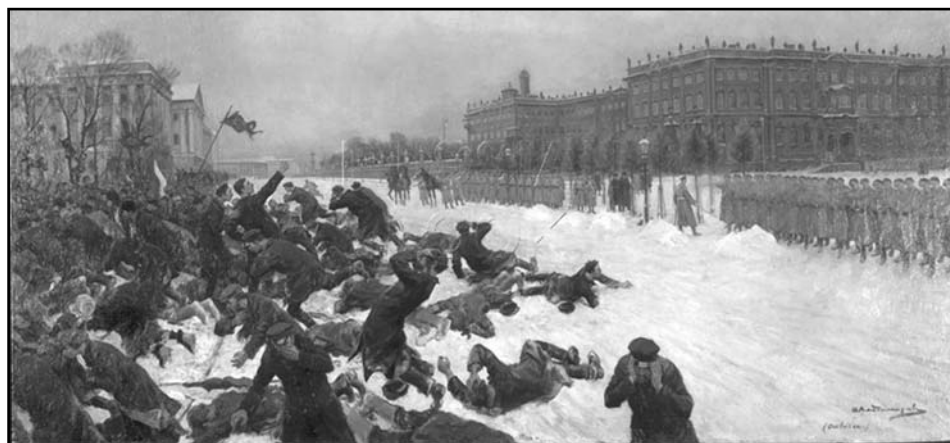
Картина художника И.А.Владимирова «Расстрел рабочих у Зимнего дворца»

Вспомни, моя милая, Девятое января. Или: Нагайка, ты нагайка! Тобой лишь одной Романовская шайка Сильна в стране родной. На жалобы и стоны Голодных русских масс Один ответ у трона — Лупить нагайкой нас. Нагайкой не убита Живая мысль у нас, И скоро паразита Пробьет последний час. Его разбоят диких Конец не за горой, Настанет час великий — И рухнет царский строй. Нагайки свист позорный Забудем мы тогда, Пойдем вперед мы дружно Под знаменем труда.