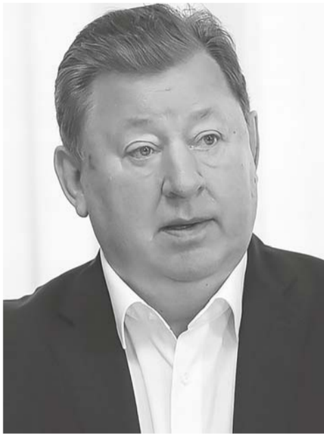
Ленинско-сталинское наследие и современность

ПРОИСХОДЯЩИЕ СЕГОДНЯ СОБЫТИЯ ВНОВЬ УБЕДИТЕЛЬНО ПОДТВЕРЖДАЮТ НЕПРЕХОДЯЩЕЕ ВЕЛИЧИЕ ТЕОРЕТИЧЕСКОГО И ПРАКТИЧЕСКОГО НАСЛЕДИЯ ВЛАДИМИРА ИЛЬИЧА ЛЕНИНА И ИОСИФА ВИССАРИОНОВИЧА СТАЛИНА, ЕГО РАСТУЩУЮ ЗНАЧИМОСТЬ И АКТУАЛЬНОСТЬ ДЛЯ СЕГОДНЯШНЕГО ВРЕМЕНИ И ДЛЯ ВСЕХ НАС.