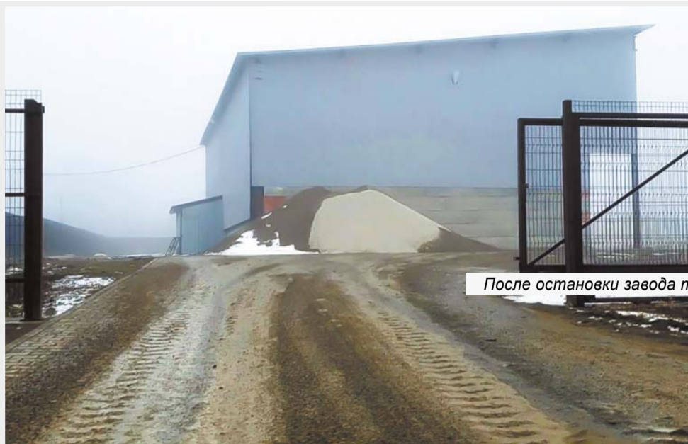
После остановки завода территория напоминает пустыню