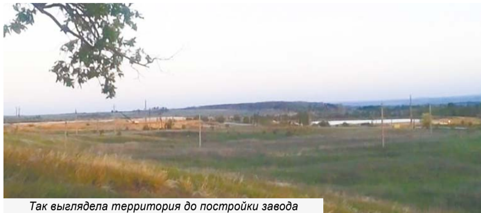
Так выглядела территория до постройки завода

ООО «Арктика» демонтировало дробильный цех, который располагался на землях сельскохозяйственного назначения. Однако остаются последствия производственной деятельности, которая пагубно сказалась на экологии пгт Балашейка и округи. Огромная территория фактически превратилась в зону отчуждения. Местные жители настаивают на проведении восстановительных работ.