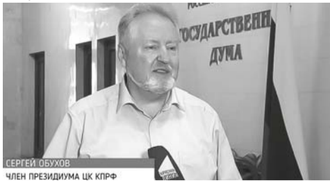
СЕРГЕЙ ОБУХОВ ЧЛЕН ПРЕЗИДИУМА ЦК КПРФ

Сергей Обухов утверждает: после введения электронного голосования принуждать бюджетников к участию в выборах стало еще проще. Людям теперь стало сложнее отвертеться от «насилованного волеизъявления». «Пресловутая цифровизация, которую так активно внедряют, позволяет проводить эту манипуляцию тише, наглее и беспардоннее», – констатирует депутат.