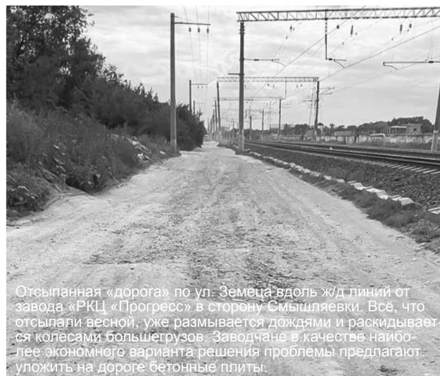
Отсыпанная «дорога» по ул. Земеца вдоль ж/д линий от завода «РКЦ «Прогресс» в сторону Смышляевки. Все, что отсыпали весной, уже размывает дождями и раскидывается колесами большегрузов. Заводчане в качестве наиболее экономного варианта решения проблемы предлагают уложить на дороге бетонные плиты.