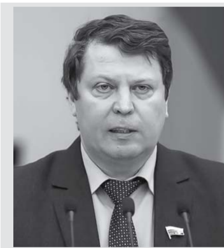
Михаил МАТВЕЕВ, депутат Государственной Думы РФ, фракция КПРФ:

– Удивительно, что столь серьезный законопроект принимается сразу в двух чтениях без какого-либо широкого обсуждения. Хотел бы сказать несколько слов о тех рисках, которые принимают на себя правительство и фракция «Единая Россия», которая обеспечила принятие законопроекта сразу в двух чтениях. Мы должны понимать, что тот объем ремонта, который сейчас государство берет на себя, он просто не реализуем на практике. Эти дома начнут сыпаться. Вот тут коллеги сказали, что целесообразно отремонтировать крышу, которая течет в 25 местах. А что вы будете делать, когда она будет течь в 25 местах? Вы будете ее ремонтировать. Иначе люди будут выходить на улицы. Я думаю, что эта программа однозначно как-то подверстывается с темой реновации и очевидно, что в головах наших чиновников, которые это затеяли, и, может быть, отчасти прокуратуры, это связано с тем, что застройщики будут сносить эти дома. Но мы видим, что как только дом признается аварийным, рыночная стоимость приватизированных в нем квартир резко падает. И мы можем столкнуться с десятками тысяч людей, которые будут выходить на площадь Славы и требовать, чтобы им предоставили хоть какое-нибудь более-менее равнозначное жилье.