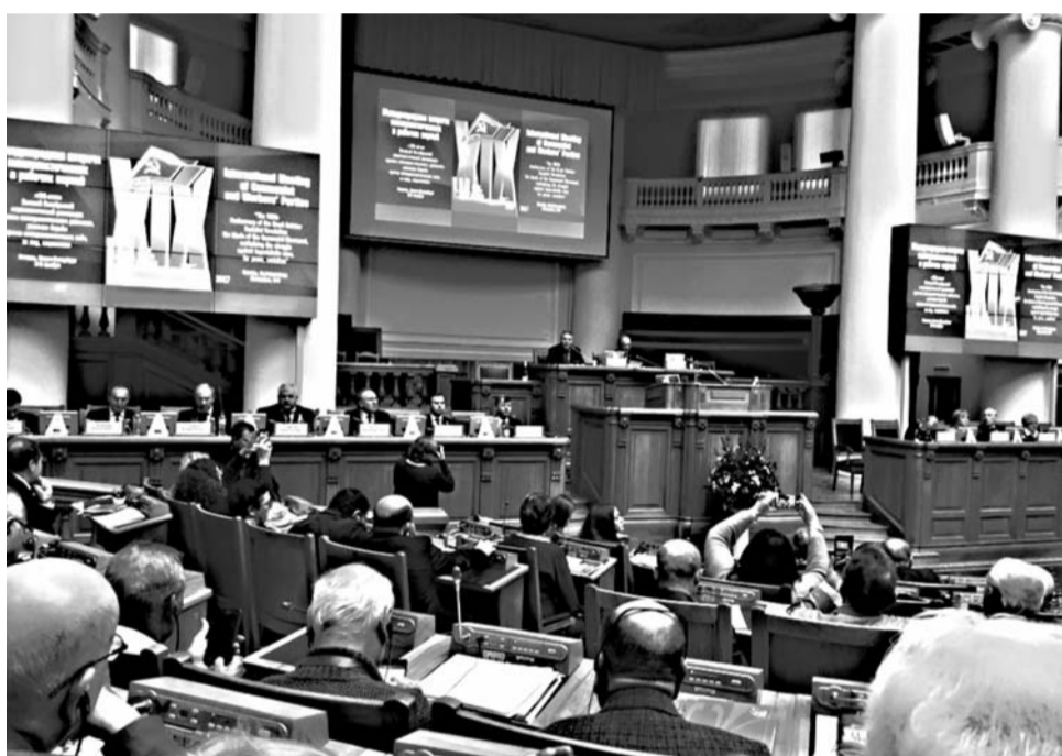
«Идеи становятся силой, когда они овладевают массами» В.И. ЛЕНИН

Коммунистическая партия Канады: «Однополярный мир превратил капитализм в империализм. Но его сотрясают кризисы, и сейчас он ставит весь мир на грань войны. Империализм пытается себя сохранить и открывает двери фашизму! Мы заявляем: либо социализм, либо варварство! Комму-