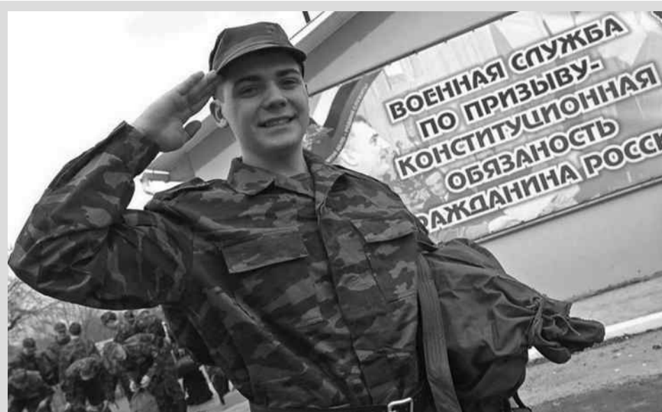
15 ноября – Всероссийский день призывника

10 ноября – День сотрудника органов внутренних дел РФ 10 ноября – Всемирный день науки 11 ноября – День экономиста 14 ноября – День социолога 20 ноября – 80 лет со дня рождения В.С. Токаревой (1937), советского прозаика, кинодраматурга 21 ноября – День бухгалтера в России 26 ноября – День матери в России