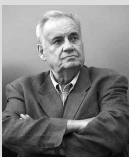
18 ноября – 90 лет со дня рождения Э.А. Рязанова (1927–2015), российского режиссера, сценариста, поэта

3 ноября – 220 лет со дня рождения А.А. Бестужева-Марлинского (1797–1837), русского писателя, критика, декабриста 3 ноября – 130 лет со дня рождения С.Я. Маршак (1887–1964), русского поэта, драматурга и переводчика 6 ноября – 165 лет со дня рождения Д.Н. Мамина-Сибиряка (1852–1912), русского писателя 7 ноября – 100 лет Октябрьской социалистической революции 1917 года.