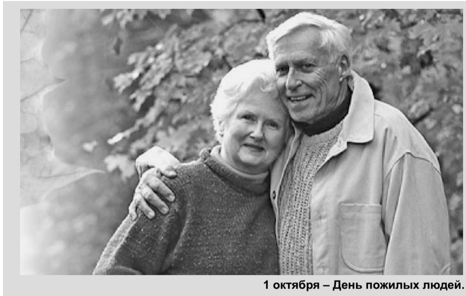
1 октября – День пожилых людей.