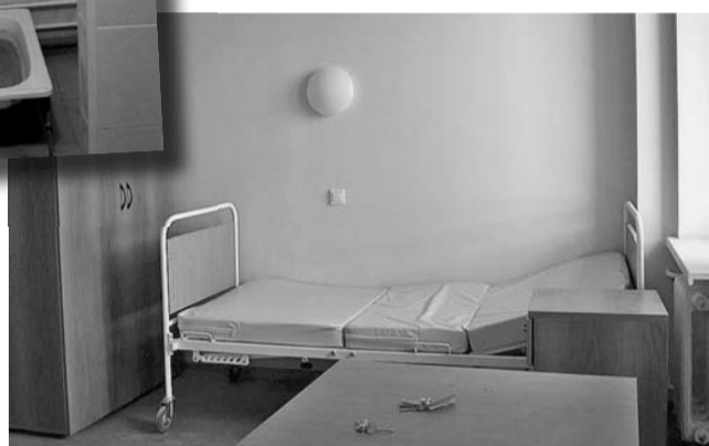
Палаты совсем небольшие