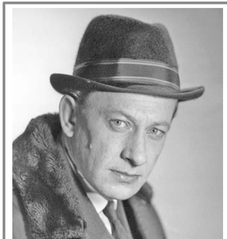
9 октября – 90 лет со дня рожд- ения Евгения Александровича Ев- стигнеева (1926–1992), актера.

4 октября – День войск гражданской обороны МЧС России.