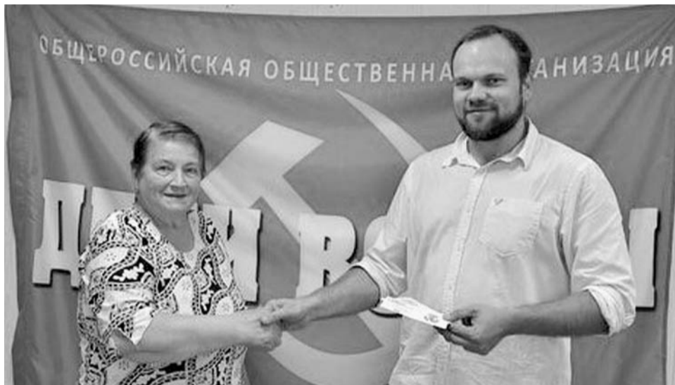
Вручение памятной медали