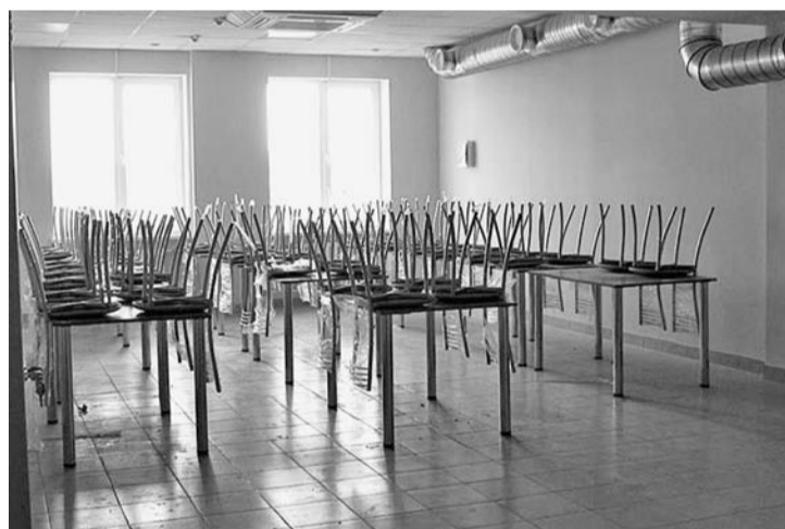
Зал для приема пищи

– здесь все замечательно, но продуктовый склад теперь концерогенен, т. к. в нем 5 лет хранили химреагенты. И там будут располагать вещи и продукты для пенсионеров и инвалидов?