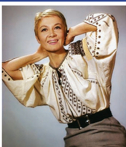
29 сентября – 80 лет со дня рождения Аллы Демидовой, актрисы, народной артистки РСФСР.