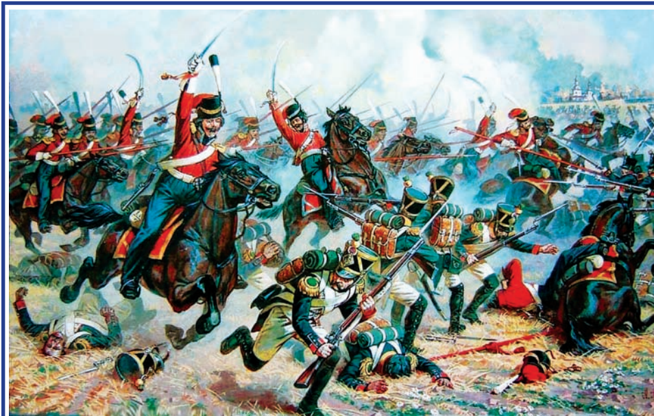
8 сентября – День воинской славы России – Бородинское сражение.