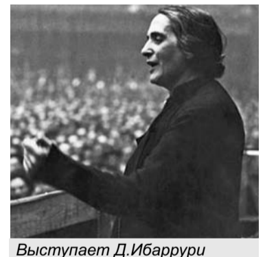
Выступает Д. Ибаррури

К 22 июля стало ясно, что блицмятеж провалился. Мятежники удержались на 1/3 территории страны. К тому же флот остал-