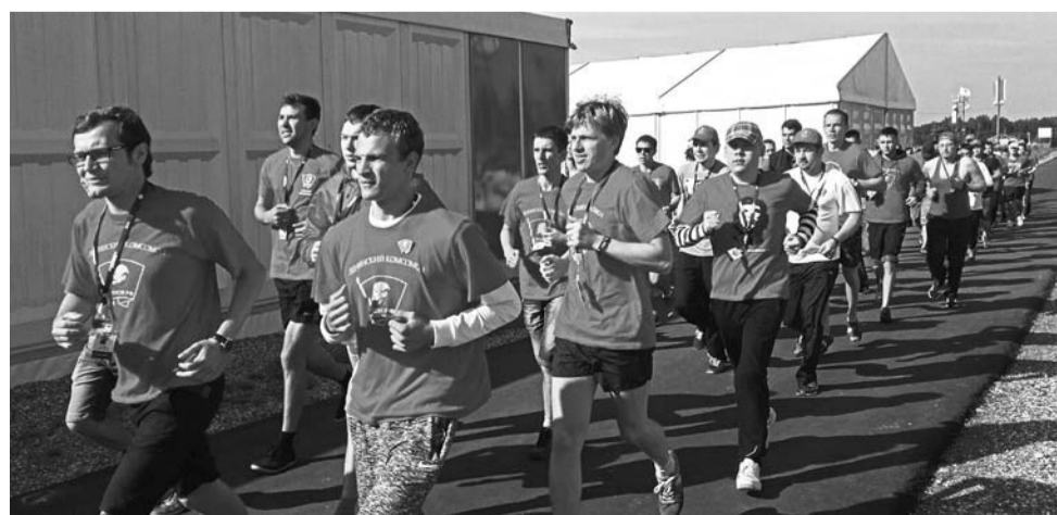
Утренняя пробежка комсомольской делегации стала уже доброй традицией