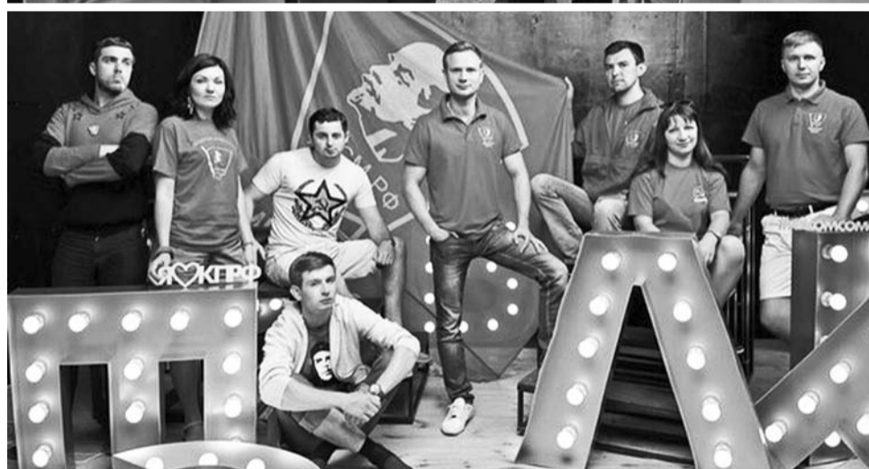
Руководители комсомольской делегации на форуме «Территория смыслов»