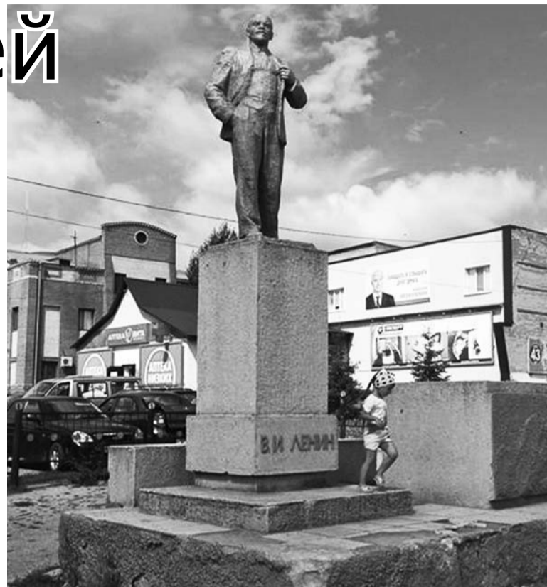
Памятник В.И. Ленину в с. Богатое, Самарская область

димир Ильич передал его мне и велел поставить порядковый номер в канцелярии. Я поднялся со стула, намереваясь распрощаться, но Владимир Ильич остановил меня и очень тепло сказал: