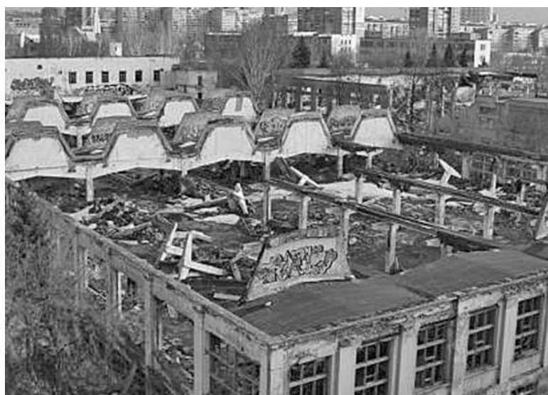
Завод им. Масленникова

Посмотрела по ТВ михалковский «Бесогон»: спасибо за смелую правду. Только вот список уничтоженных предприятий в программе был далеко не полным. Почему-то не упомянули ни одного погибшего предприятия нашей Самары!