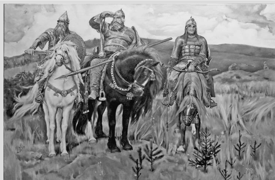
23 июля (1926 г.) – день памяти В.М. Васнецова, великого русского художника

25 июля (1916 г.) – день памяти М.А. Ульяновой, матери Владимира Ильича Ленина