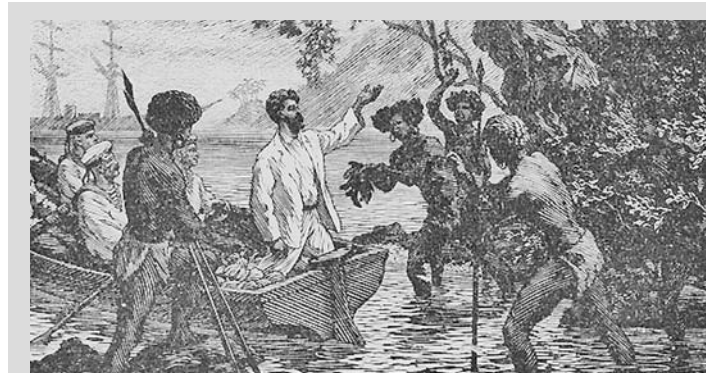
18 июля – День этнографа, профессиональный праздник представителей различных этнографических школ. Введен в честь дня рождения этнографа и путешественника (1846 г.) Н.Н. Миклухо-Маклая

26 июля (1831 г.) – день рождения И.Н. Ульянова, отца В.И. Ленина