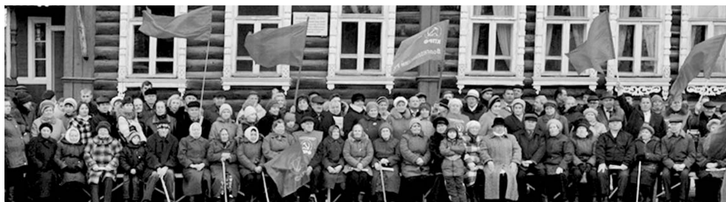
Через 90 лет лет кашинцы отметили юбилей приезда к ним В.И. Ленина

ВНИМАНИЕ! Возобновляет работу общественная приемная газет «Правда» и «Трудовая Самара». Прием посетителей по понедельникам и пятницам с 11:00 до 15:00.