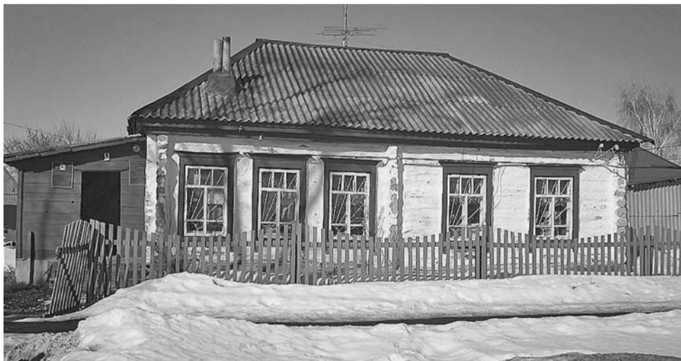
На фото: в таких особняках живет районная власть (вверху), а в таких – существует библиотека (внизу); стены Дома молодежи в райцентре (в середине)