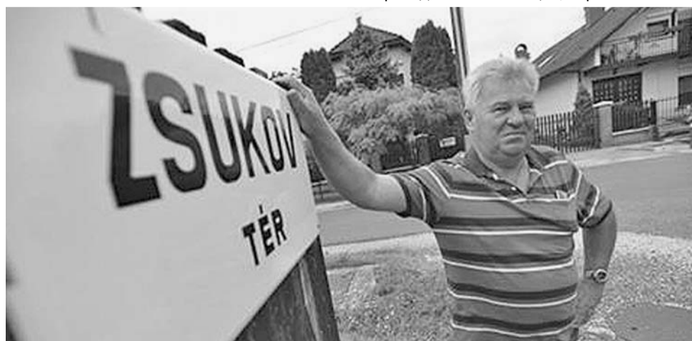
Фото из Венгрии!

Что ж, приятно, что о наших земляках помнят в других странах и даже выступают против забвения их имен. Но главное – чтобы мы сами у себя не позволяли этого делать, иначе в топилмии города скоро не найдем следов нашей советской истории.