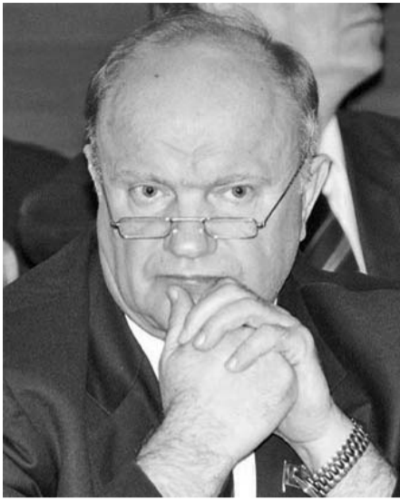
ЗЮГАНОВ Геннадий Андреевич, председатель ЦК КПРФ, руководитель фракции КПРФ в Госдуме ФС РФ