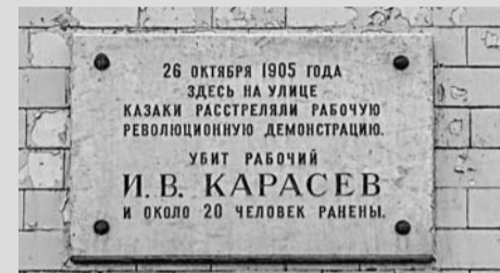
расёв через два дня скончался. В 1925 г. на здании почтамта установлена мемориальная доска из белого мрамора.