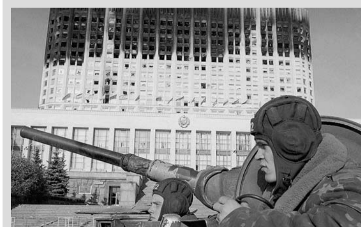
3-4 октября 1993 г. – Трагические события в Москве. Расстрел из танковых орудий Дома Советов. По официальным данным, в Останкине и у Дома Советов убито около 200 человек.