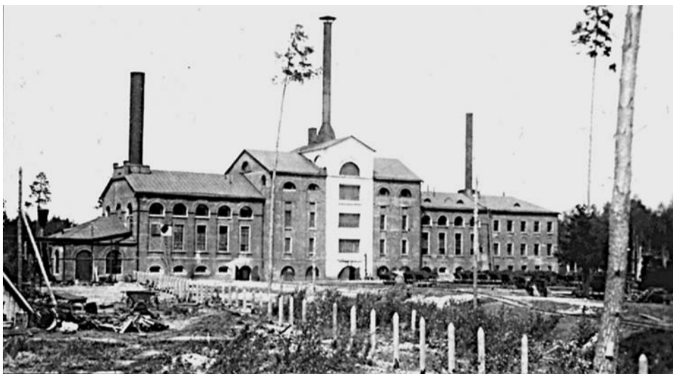
Первое здание Шатурской ГРЭС, построенное еще в 1920 году. Через пять лет оно было заменено более солидным строением.

С Владимиром Ильичем у меня было несколько встреч и бесед по вопросам моей тогдашней служебной деятельности.