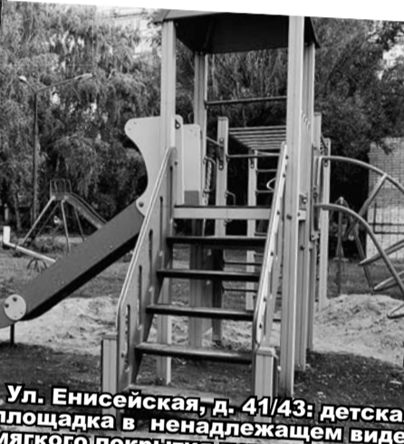
Ул. Енисейская, д. 41/43: детская площадка в ненадлежащем виде, мягкого покрытия нет