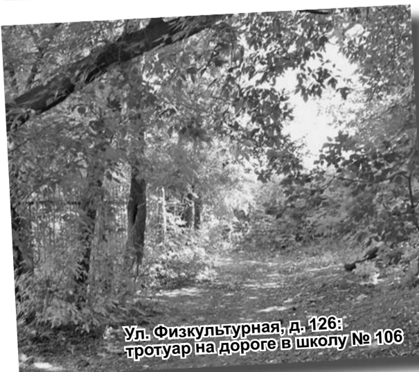
Ул. Физкультурная, д. 126: тротуар на дороге в школу № 106