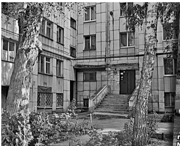
Ул. Енисейская, д. 37: прорыв канализации, управляющая компания ООО «Жилуниверсал» бездействует