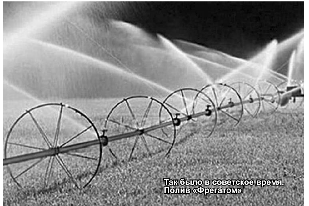
Так было в советское время. Полив «Фрегатом»

гачева Ф.Рауткин вспоминает, как гонял всяческое ворье, хотя ему показывали разрешительные бумаги с печатями. А потом понял, что один он уничтожение оросительной системы остановить не сможет: