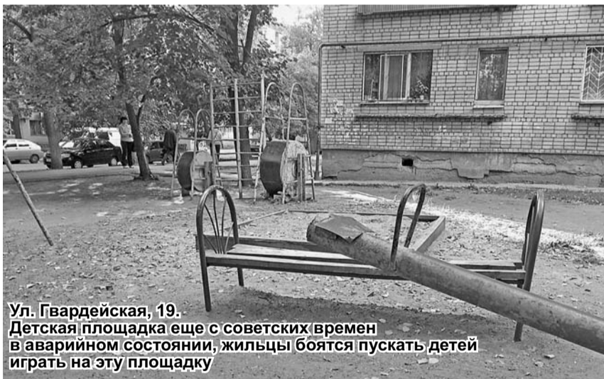
Ул. Гвардейская, 19. Детская площадка еще с советских времен в аварийном состоянии, жильцы боятся пускать детей играть на эту площадку