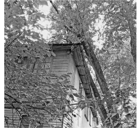
Ул. Металлистов, 46. Деревья практически лежат на крыше дома. Требуется срочная опилка