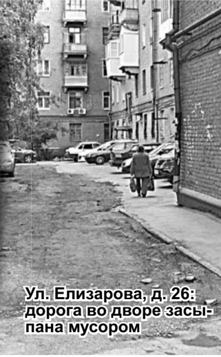
Ул. Елизарова, д. 26: дорога во дворе засыпана мусором