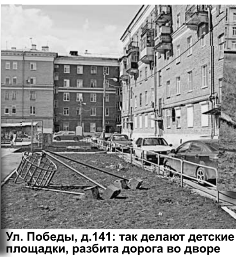
Ул. Победы, д. 141: так делают детские площадки, разбита дорога во дворе