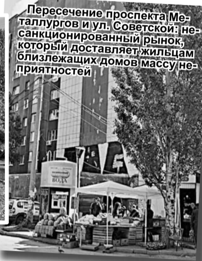
Пересечение проспекта Металлургов и ул. Советской: несанкционированный рынок, который доставляет жильцам близлежащих домов массу неприятностей