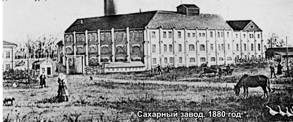
Сахарный завод. 1880 год