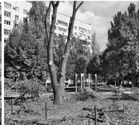
Ул. Енисейская, д. 39: не убраны спиленные деревья, детская площадка не доделана