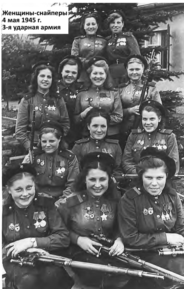
Женщины-снайперы 4 мая 1945 г. 3-я ударная армия