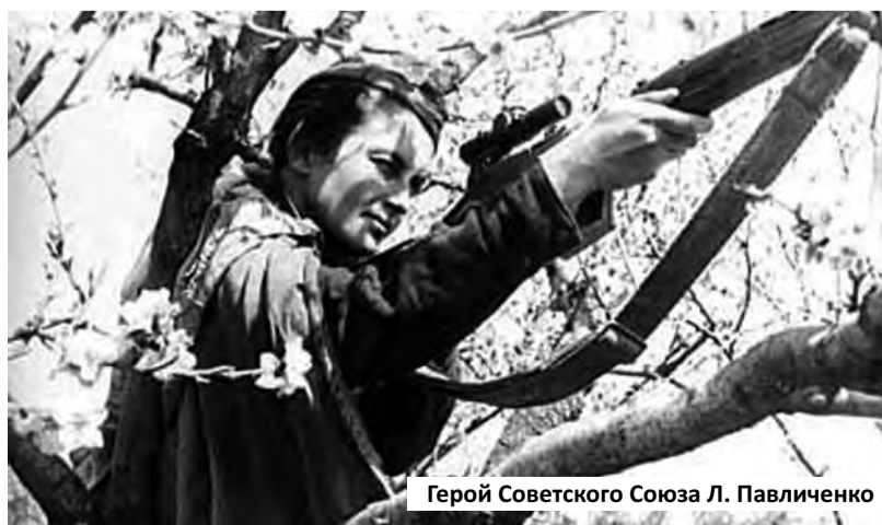
Герой Советского Союза Л. Павличенко