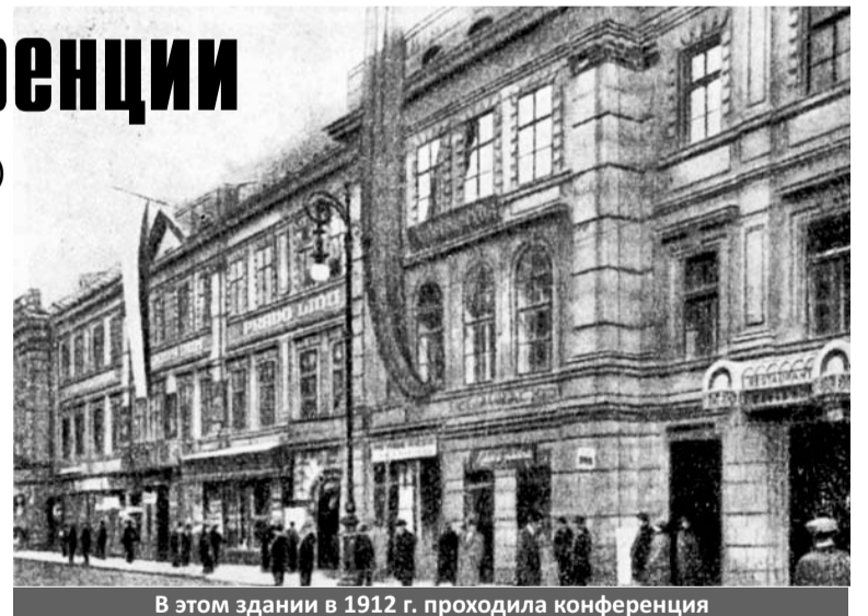
В этом здании в 1912 г. проходила конференция

Я был докладчиком по вопросу о страховании рабочих. Составленный мною еще в Париже