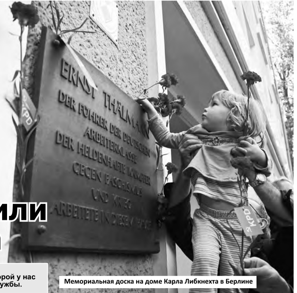
Мемориальная доска на доме Карла Либкнехта в Берлине