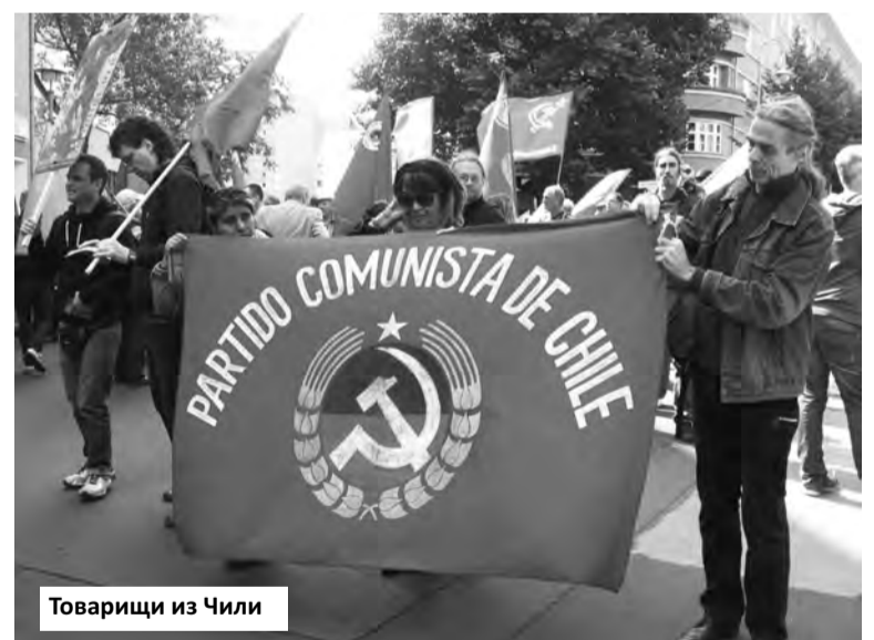
Товарищи из Чили