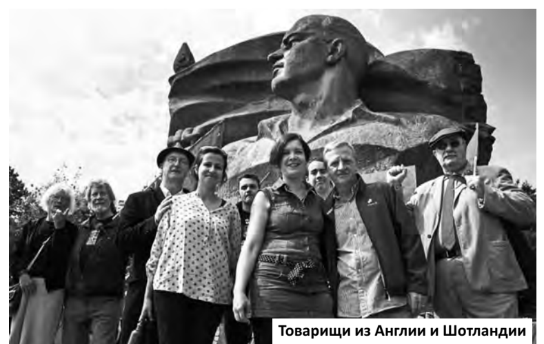
Товарищи из Англии и Шотландии