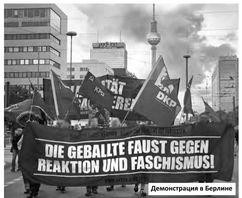
Демонстрация в Берлине