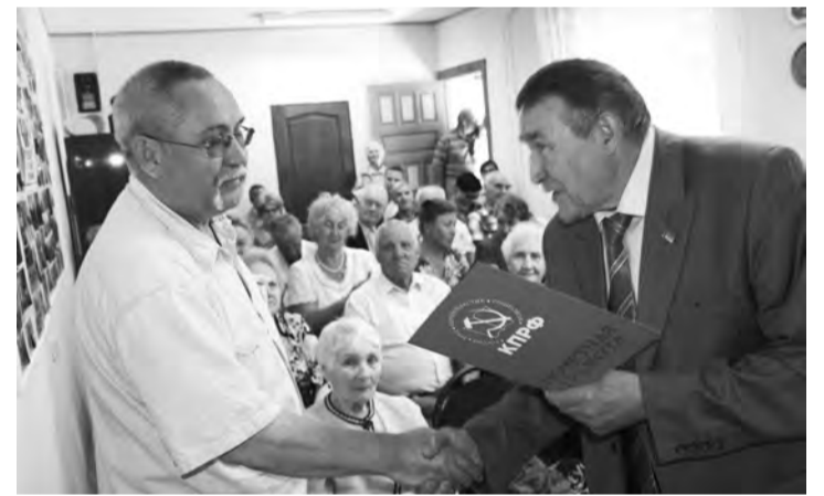
Активисты Компартии отмечены почетными грамотами обкома и горкома КПРФ