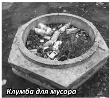
Клумба для мусора