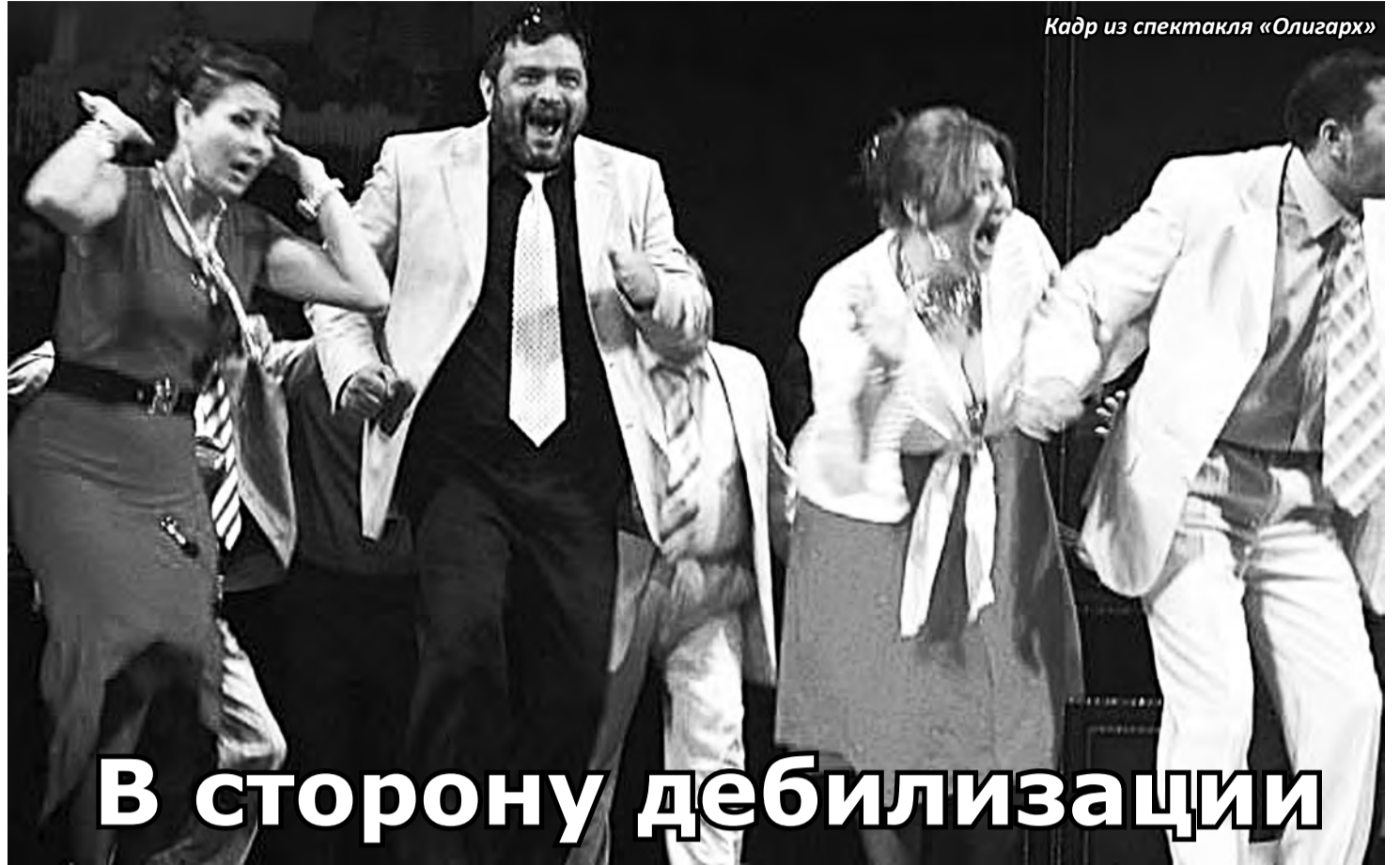
Кадр из спектакля «Олигарх»