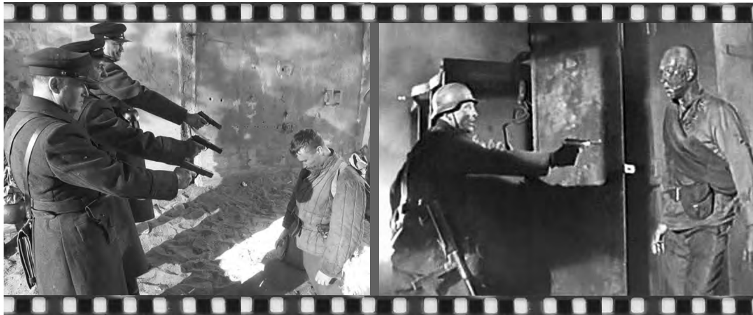
Суть фильма - в двух кадрах