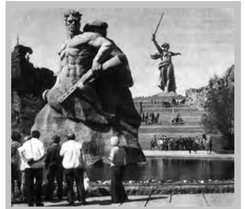
28 декабря 1908 г. – день рождения Е.В. Вучетича, советского скульптора, Героя Социалистического труда.