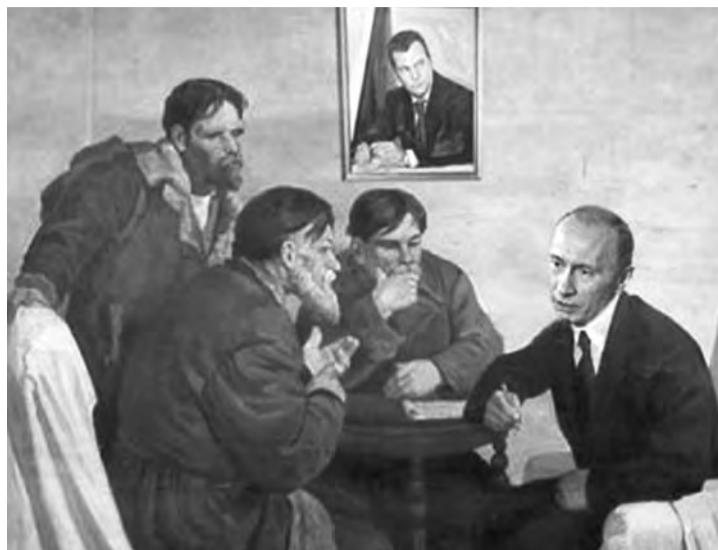
Топ-менеджеры АвтоВАЗа просят вернуть свои бонусы