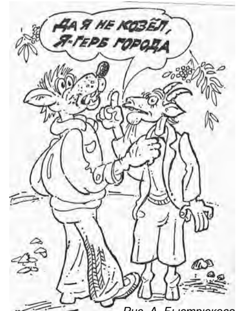
Рис. А. Быстрыкова