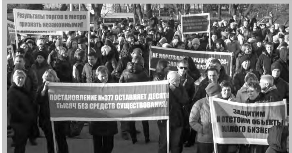
14 ноября в Самаре состоялся массовый митинг предпринимателей против политики городских и областных властей по ликвидации в областном центре нестационарных торговых точек. Подробности в следующем номере.