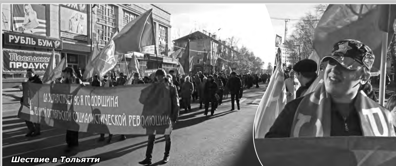
Шествие в Тольятти