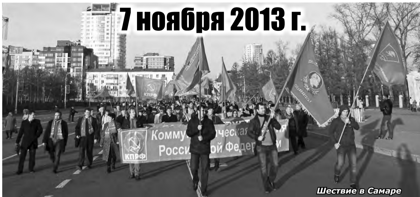
Шествие в Самаре