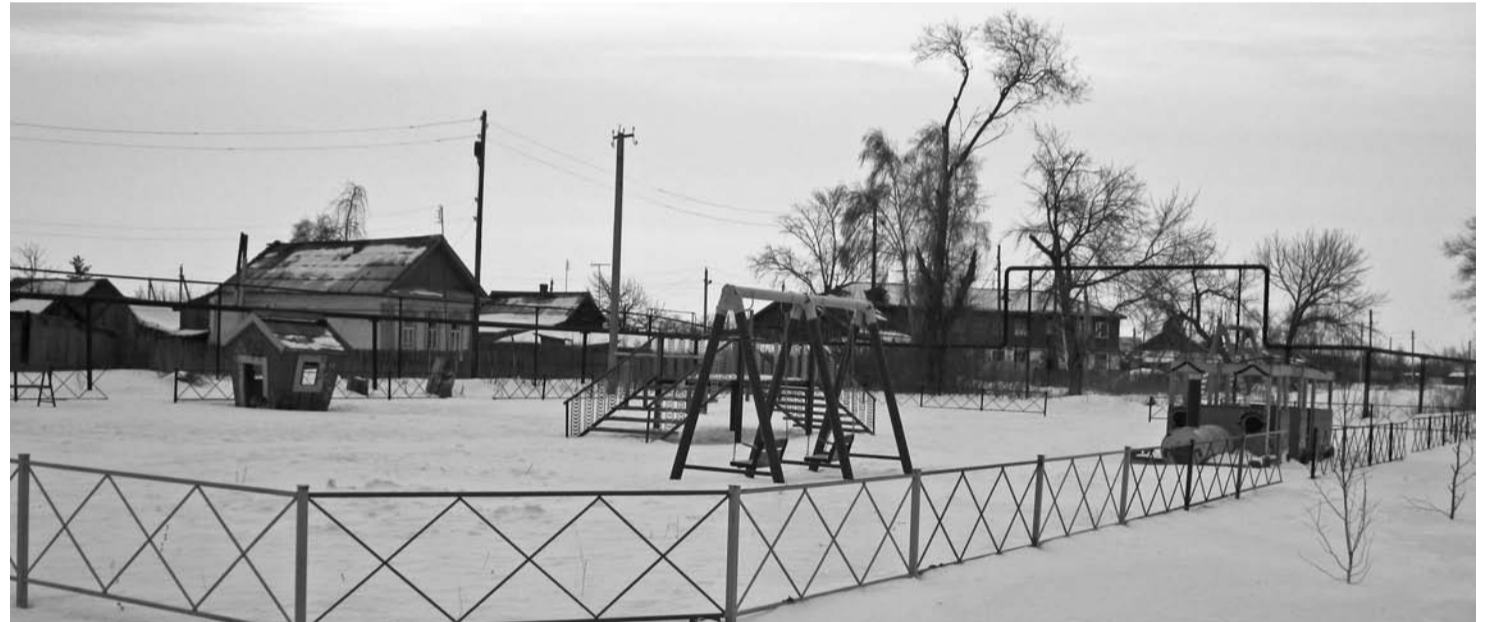
Новая детская игровая площадка в Обшаровке