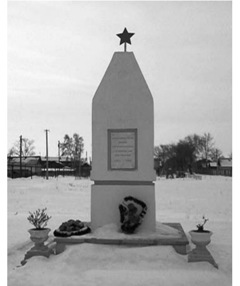
Восстановленный памятник Славы