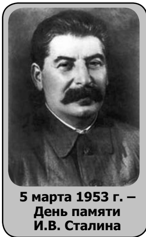
5 марта 1953 г. – День памяти И.В. Сталина