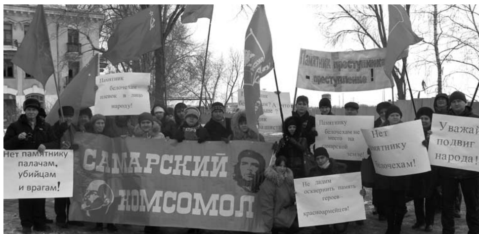
Участники пикета против установления памятника белочехам в Самаре

В субботу 16 февраля на улице Красноармейской в Самаре состоялся пикет против установки в городе памятника белочехам. Коммунисты и комсомольцы в едином порыве выступили против увековечивания памяти палачам и убийцам советских людей.