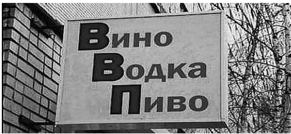
ВВП в России стабильно растет