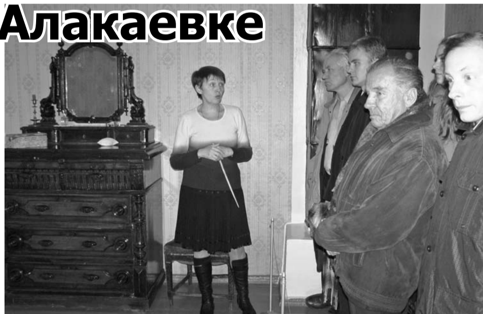
Хористы на экскурсии

Но зато какое богатство духовное: все члены семьи учили и знали иностранные