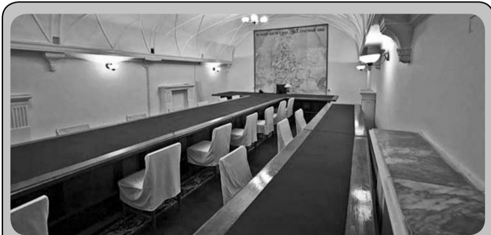
16 декабря 1942 г. Принят в эксплуатацию бункер Сталина в г. Куйбышеве. Основные работы по строительству бункера начались в феврале 1942 г.