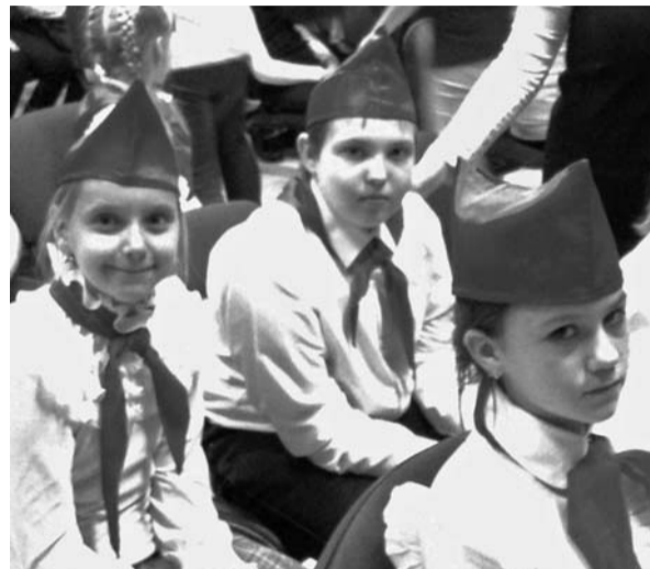
Пресс-центр организации «Пионеры Самарской области»

Самым запоминающимся событием, по словам участников заезда, стала военно-патриотическая игра «Зарница», где пионеры проявили храбрость, ловкость, сплоченность. Также было очень много и спортивных мероприятий – таких как «А ну-ка мальчики!», «А ну-ка девочки!», а каждое утро неизменно начиналось с зарядки. День проходил незаметно, вечером отряды вместе с вожатыми представляли отчет о своей работе в творческой форме. За эти 4 дня ребята очень подружились, и расставаться не хотелось, но каждый увозил с собой багаж новых знаний и отличное настроение!