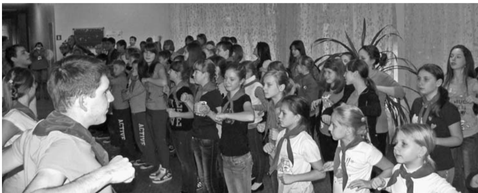
Пионерские мероприятия во время заезда в «Радугу»