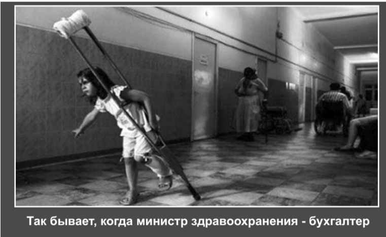
Так бывает, когда министр здравоохранения - бухгалтер