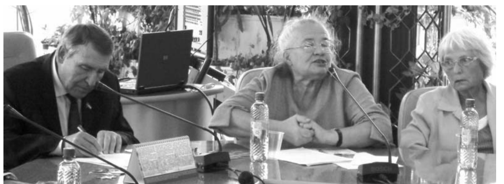
На снимках: участники памятной встречи в губернской думе