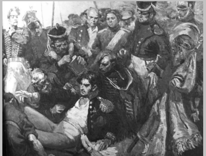
24 сентября 1812 г. – День смерти П.И. Багратиона, русского полководца, героя Отечественной войны 1812 г.