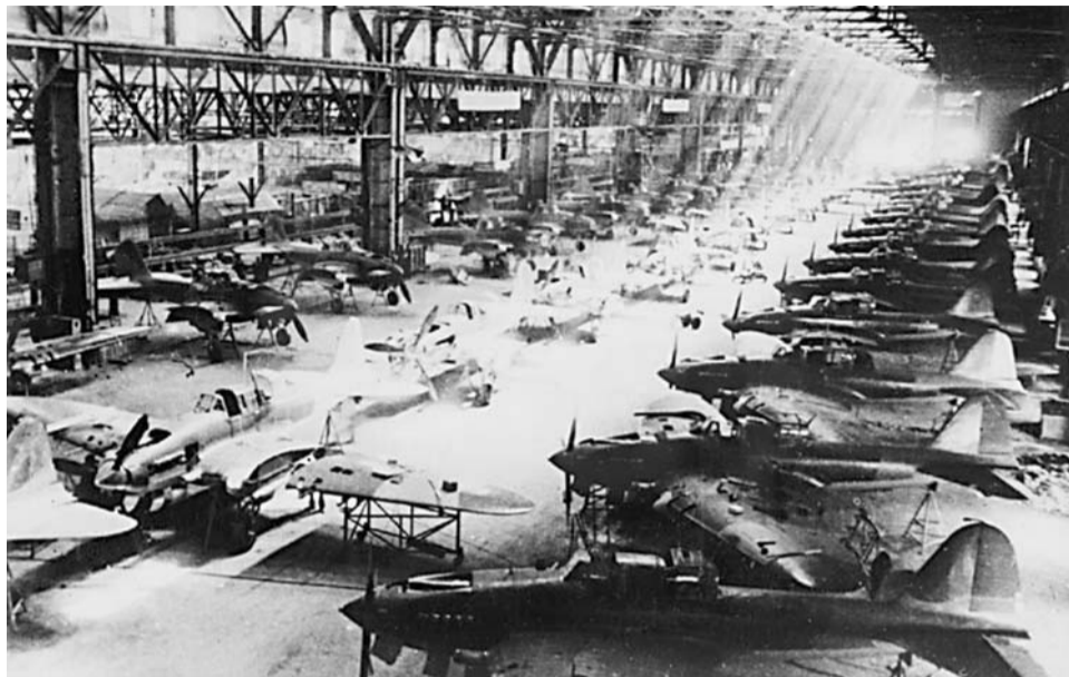
На заводе им. Сталина

Инициативная группа жителей самарской Безымянки решила, что пора создать в ДК «Победа» музейно-образовательный центр трудовой славы «Безымянка». Где любой школьник мог бы потрогать пушку НР-23, ленту со снарядами к ней, своими глазами увидеть прицел АСП-ЗНМ в кабине Мига-15, услышать эту историю, а затем и другие из уст экскурсовода. Чтобы затем более осмысленно выбрать для себя техникум, институт, завод, КБ, где потом будет осуществляться свои ценные для страны замыслы, как это делали герои этой публикации. И не будет поддаваться пустым мечтаньям о своем кафе или киоске, о карьере только юриста, банкира, Чубайса или Пугачевой. Сегодня инициаторы предложили для «ТС» часть материалов о том, о чем может быть рассказано в музейном центре.