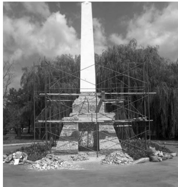
Памятник павшим героям Гражданской войны в Новокуйбышевске

Имя самого Михаила Самуиловича овеяно легендой. Обстоятельства смерти его точно неизвестны. По одной из версий, узнав из телеграфного сообщения о катастрофическом положении под станцией Липяги, Кадомцев один, захватив лишь ординарца, выехал туда на ручной дрезине. У входного семафора он был смертельно ранен.