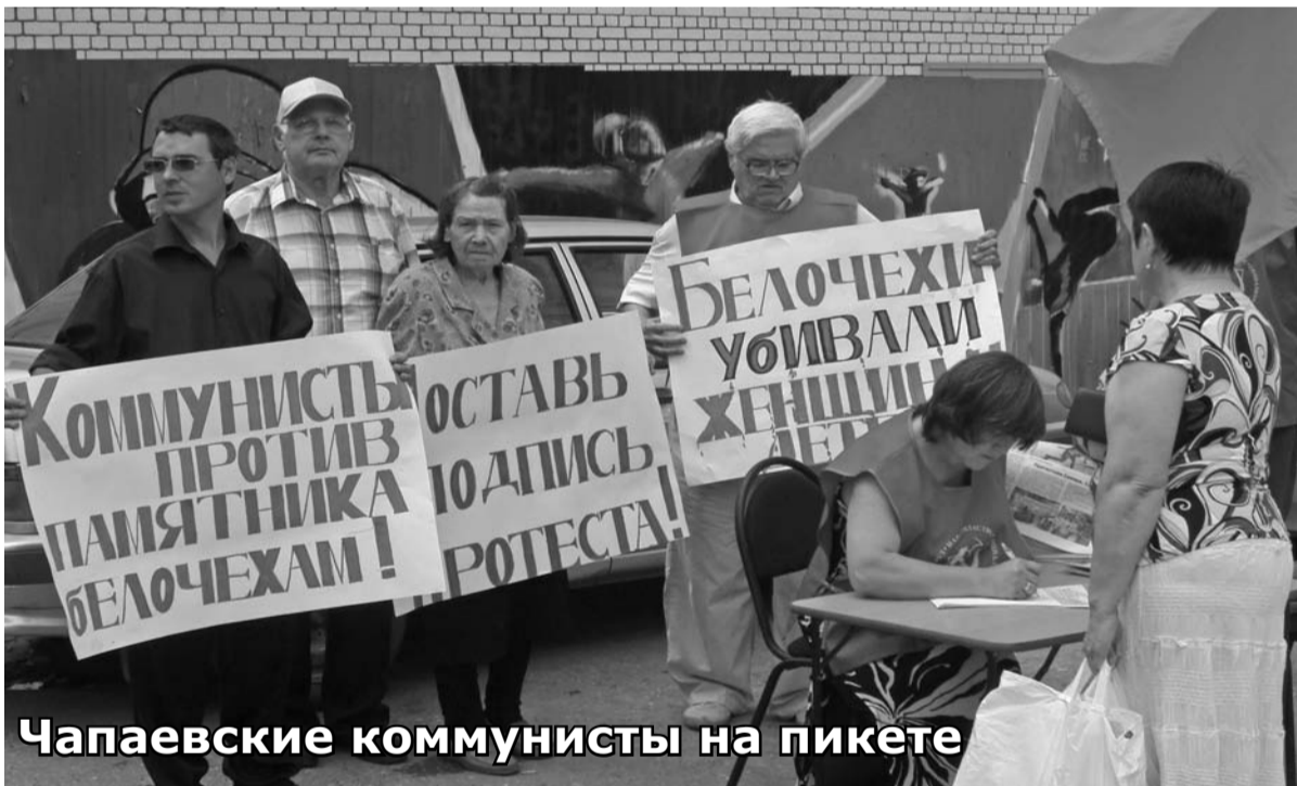
Чапаевские коммунисты на пикете

Однако трудно сказать, способен ли данный слуга служить кому-то верно. Совсем недавно он облил грязью партийную организацию. Возможно, что следующий пакость будет в адрес городской администрации? Тем более что он неоднократно возмущался нынешней администрацией, рассказывая о нечистоплотности работников, об угрожающей коррупции и даже финансовых махинациях. Запомнилась его фраза о некоторых работниках «что они «хапают всем чем можно, готовы даже мягким местом». Вот уж истине — предавший однажды предает и дважды. С такой жизненной позицией