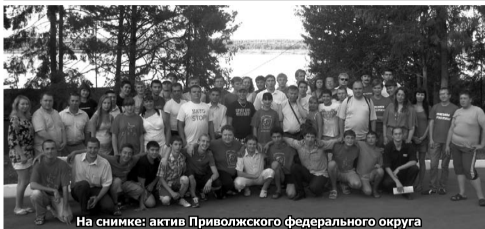
На снимке: актив Приволжского федерального округа