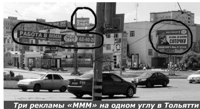
Три рекламы «МММ» на одном углу в Тольятти