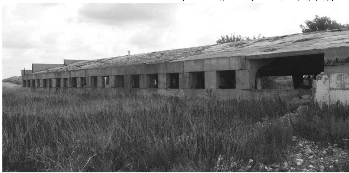
Такая картина типична для Сергиевского района

направлен в Сергиевский РОВД, сотрудники которого усмотрели в действиях «неустановленных лиц» администрации состав преступления, предусмотренный ст. 293 (халатность), и в очередной раз отказали в возбуждении уголовного дела якобы в связи с истечением срока привлечения к уголовной ответственности... Кстати, сам А.Шипицин, по нашим данным, отказался дать какие-либо пояснения сотрудникам ГУВД.