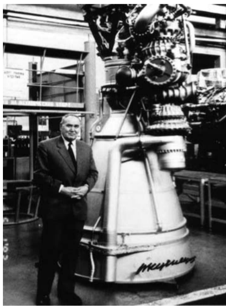
Николай Кузнецов, его именем назван двигатель серии НК

Но, помимо упомянутых открытий, русскими были изобретены или впервые разработаны: водонапорная башня, доменная печь, первый искусственный спутник Земли, первый космический аппарат, парашют, вертолет, телевизор, атомная электростанция, лазер, водородная бомба, лампа накаливания, триггер, гальванометр, идея транзистора, водолазный аппарат, индукционная печь,