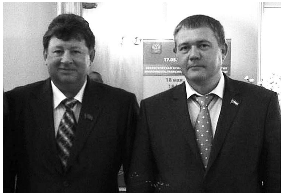
Председатель Комитета Госдумы по природным ресурсам, природопользованию и экологии В.КАШИН и зампредела Комитета по ЖКХ, ТЭК, нефтехимии и охране окружающей среды СГД К.РЯДНОВ

В настоящее время в Самарской области разработана и реализуется областная целевая про-