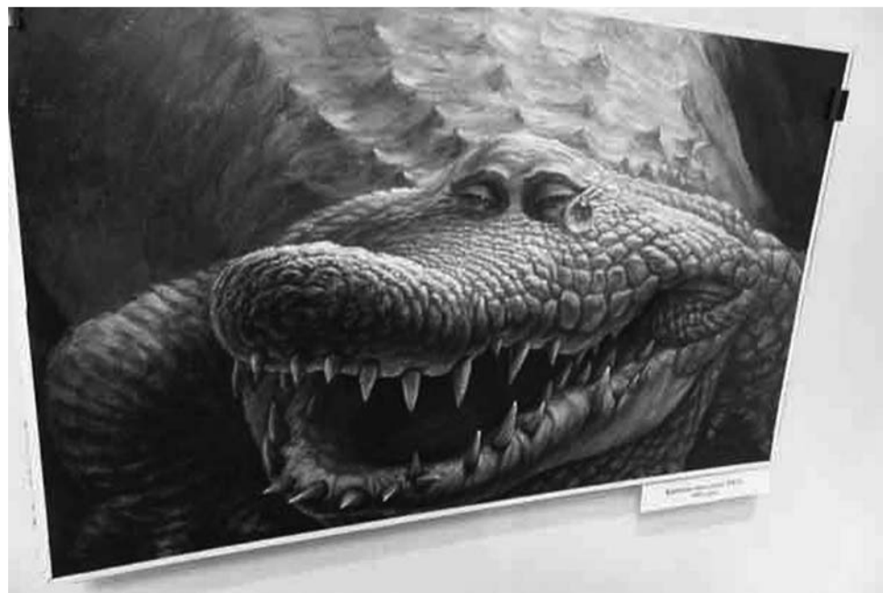
На одной из выставок эта карикатура была запрещена к показу и удалена из экспозиции, так как напоминала посетителям одного из нынешних руководителей РФ