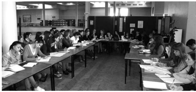
Участники конференции в библиотеке