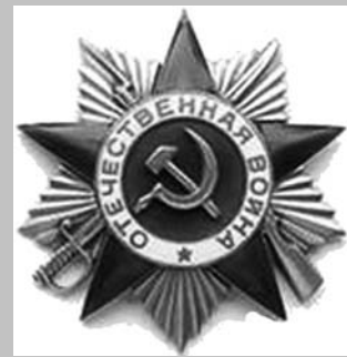
20 мая 1942 г. — учрежден орден Отечественной войны