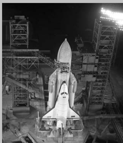
15 мая 1987 г. — состоялся первый пуск ракеты-носителя «Буран», изготовленной на куйбышевском заводе «Прогресс»