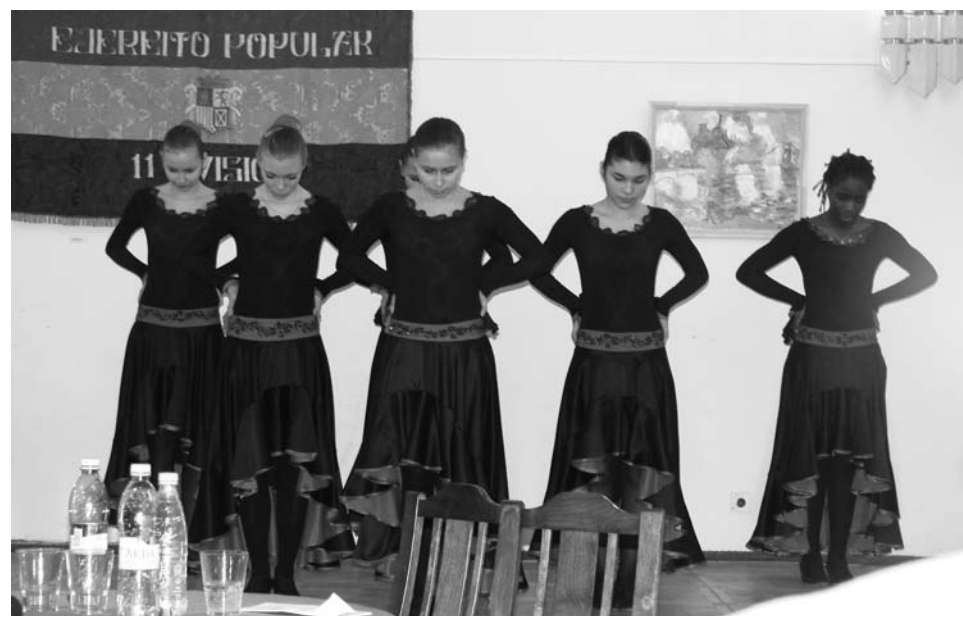
Испанский танец воспитанниц детдома