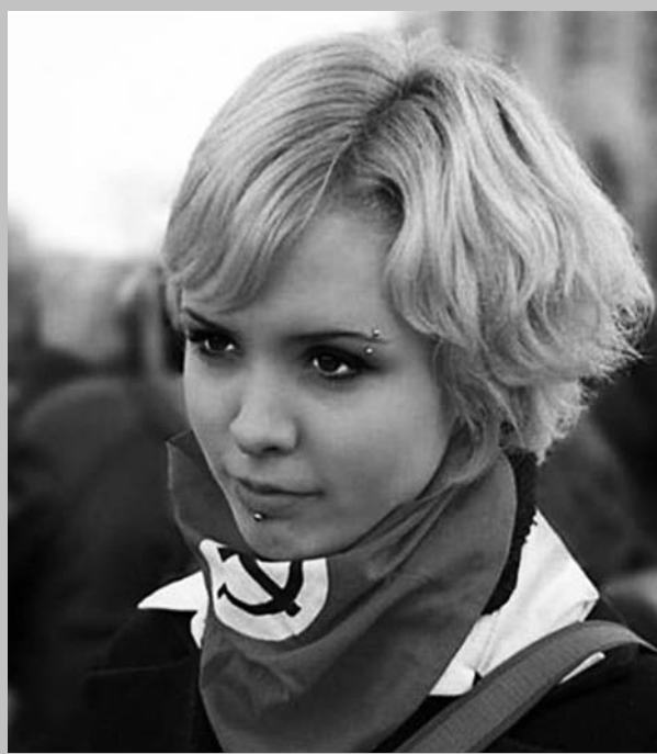
Ее зомбировали коммунисты А ведь демократия давала ей право стать проституткой