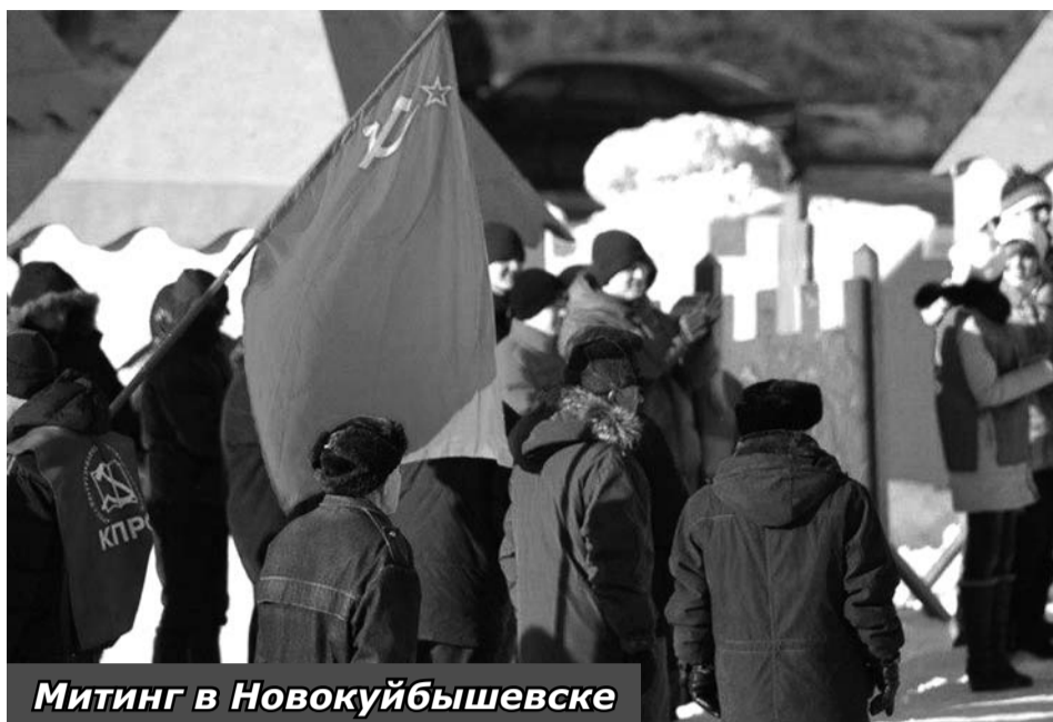
Митинг в Новокуйбышевске