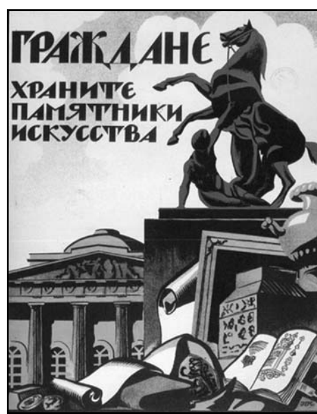
Плакат советских времен

В 1924 г. был утвержден декрет СНК «Об организации кинодела в РСФСР». Кинофильмы об А.Суворове, А.Невском,